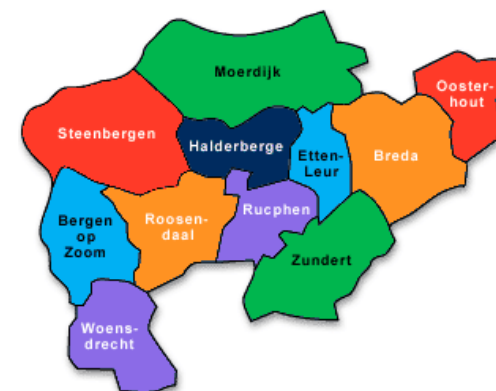
Figuur 1: kamergebied West Brabant

Het is niet eenvoudig om een allesomvattende definitie te geven van zorgeconomie. Het omvat in principe alle economische activiteiten die direct of indirect een relatie hebben met zorg. Zorgeconomie is daarmee meer dan alleen gezondheid- en welzijnszorg. Het gaat ook om een breed scala aan andere zorggerelateerde activiteiten zoals: medische en zorggerelateerde productie, (groot)handel in zorgproducten, detailhandel, zorgspecifieke en medische research & development, zakelijke en financiële dienstverlening (zorgverzekeraars e.d.), zorgopleidingen, wellness en sport (zie figuur 2). In bijlage A wordt uitgebreid ingegaan op de afbakening van het begrip zorgeconomie en de economische betekenis van deze verschillende (deel)segmenten binnen de zorgeconomie in West-Brabant.